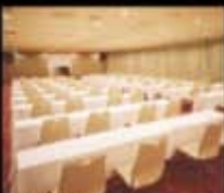
コンベンションホール